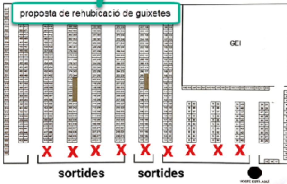
Les X representen els nous armariets